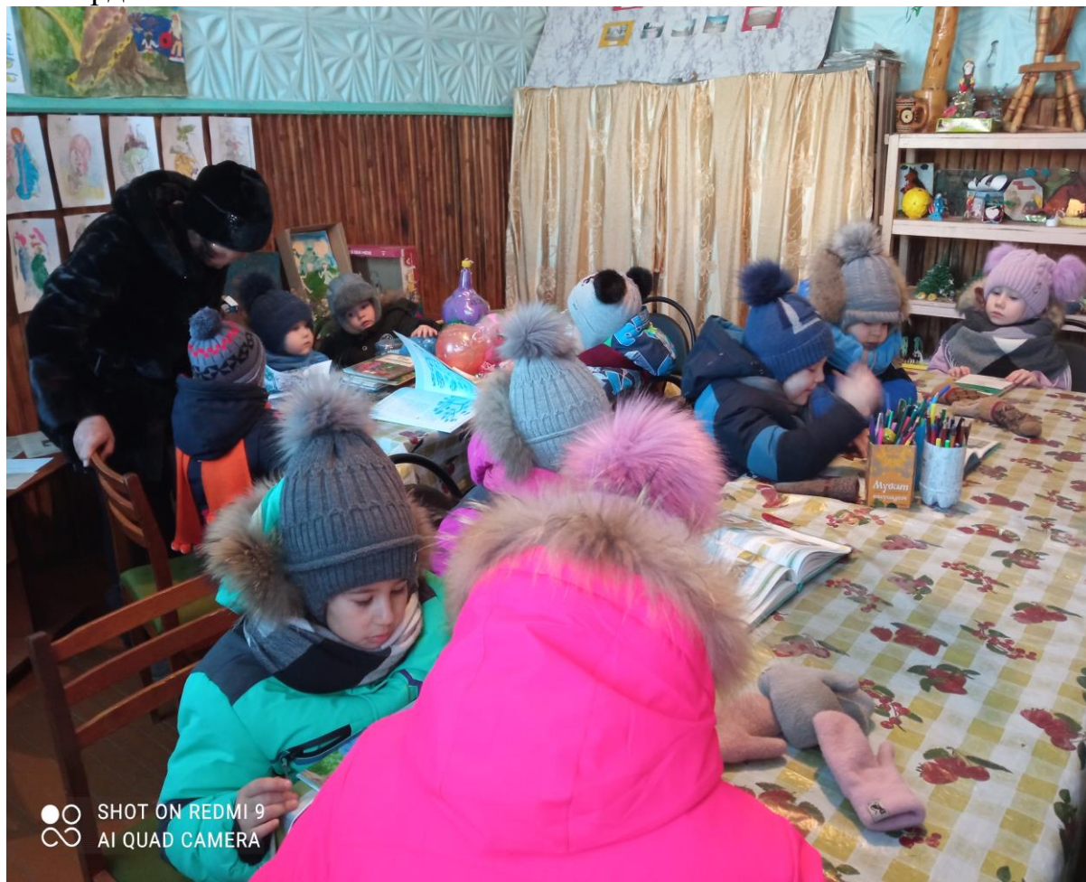
Просмотр презентации «Как жили Славяне?»